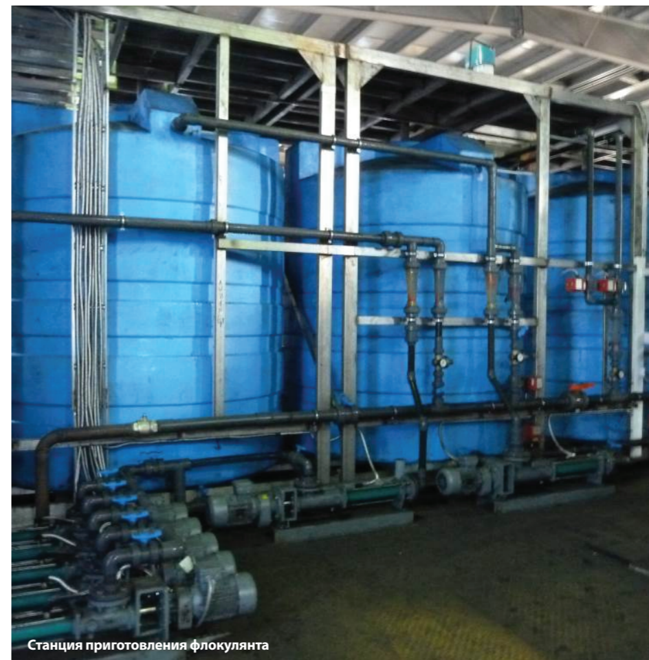
Станция приготовления флокулянта