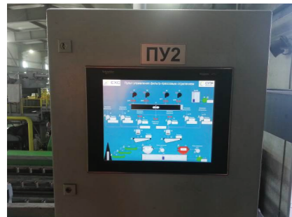
Пульт управления фильтр-прессовым отделением